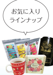
お気に入り ラインナップ

のんびりと紅茶を飲みながら、家事をしたり、撮り溜めたドラマを見たり、長編アニメを見たり…あまり頭を使わずボンヤリと過ごします。なのでゆっくりリラックスできる休日の雨の日はそんなに嫌いじゃないですね。笑