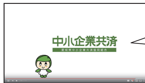
愛知県中小企業共済様「組合プロモーション動画」

TVCMの制作も手掛ける弊社は、企業PR、製品PR用のプロモーションビデオも得意！映像は短時間で多くの情報を伝達・浸透させ、人の心を動かすことができる重要なツールです。