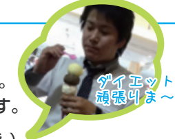
ダイエット頑張らま〜す

ドMダイエットは、マジメにダイエットを行えば行うほど「ドMな体験ができる」アプリ。「ダイエットを頑張れば頑張るほどアプリは「ドS」になっていき、ダイエットを成功へと導いてくれるのです。自分で課したタスク(メニュー)を馬車馬のようにこなす。すると、お姉さまから「★」が貰えるという仕組みです。