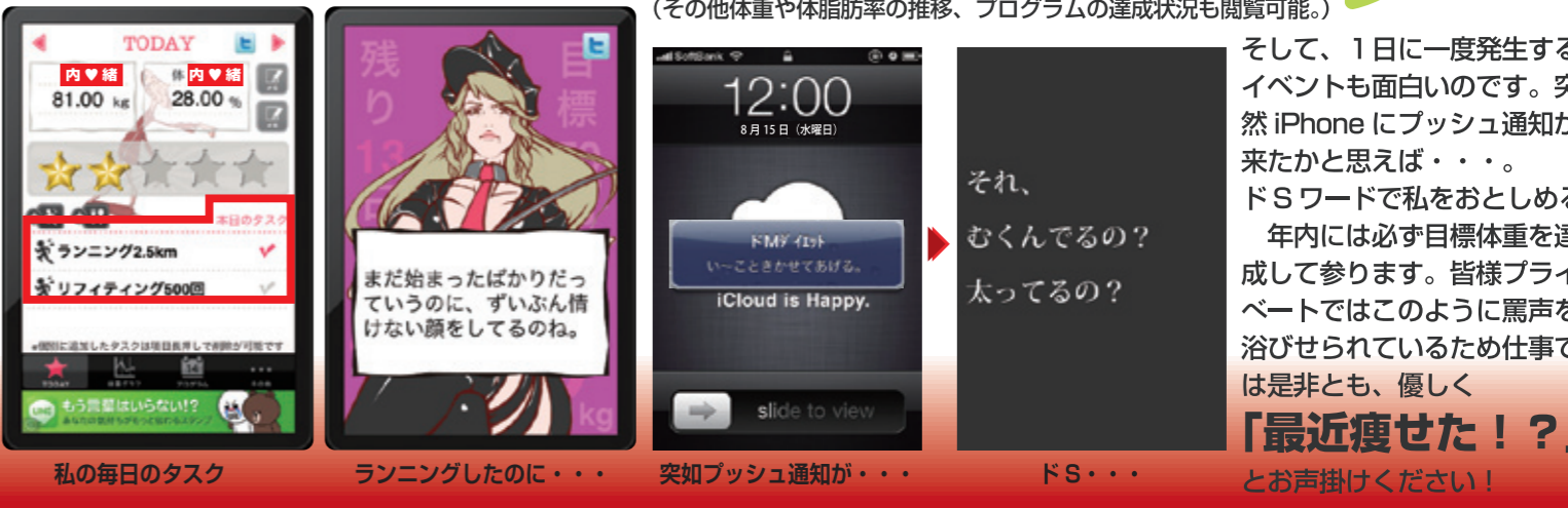
(その他体重や体脂肪率の推移、プログラムの達成状況も閲覧可能。)

そして、1日に一度発生するイベントも面白いのです。突然iPhoneにプッシュ通知が来たかと思えば...。ドSワードで私をおとしめる。年内には必ず目標体重を達成して参ります。皆様プライベートではこのように罵声を浴びせられているため仕事では是非とも、優しく「最近痩せた!?!」とお声掛けください!